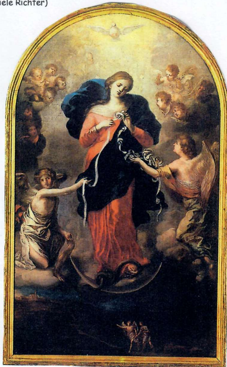
Maria, die Knotenlöserin Augsburg